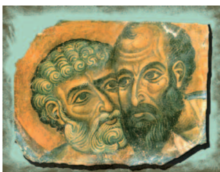
SICOA: NEL SEGNO DELL'AMICIZIA I Santi Apostoli Pietro e Paolo